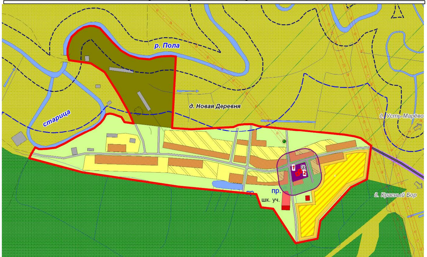
Рис. 4.3.1. Схема развития деревни Новая Деревня (за пределами расчетного срока)